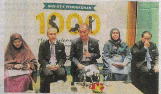
Dr Dzulkefly (tengah) dalam sidang akhbar di Putrajaya pada Selasa.

berpendapatan tinggi tetapi tidak memberikan diet yang sempurna kepada anak-anak dan kita terkejut ia berlaku di Putrajaya," kongsinya.